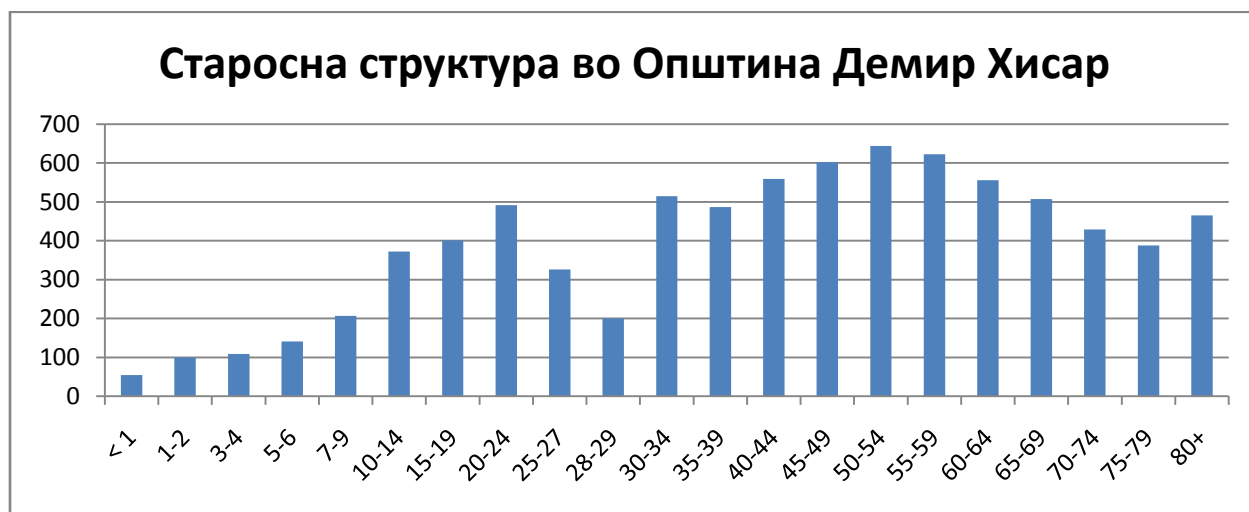
Табела - Старосна структура во Општина Демир Хисар

Од табелата може да се види дека во Општина Демир Хисар најголем процент од населението е на возраст од 30-69 години односно 54,95 %.