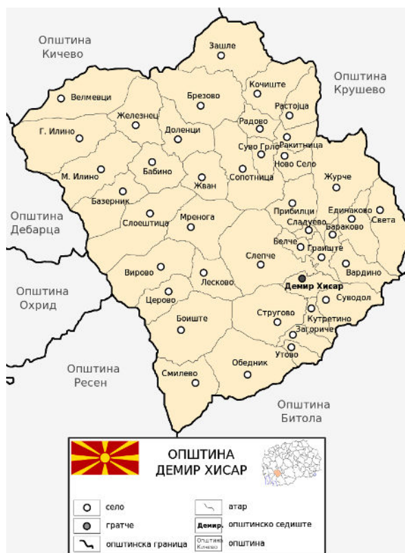
Слика 3. Карта на Општина Демир Хисар со селски атари

Според својата географска диспозиција, Општина Демир Хисар е сместена во југозападниот дел на Република Македонија, во просторот во горното сливно подрачје на река „Црна“ која тече низ средишниот дел на општината. Се простира на надморска висина од 620 м до 2000 м. Опкружена е од сите страни со ридско-планинско земјиште кое се издига над рамничарските алувијални терени и создава природна целина отворена по текот на река „Црна“.