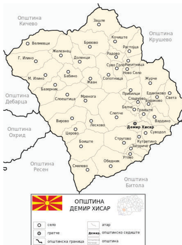
Слика бр. 2: Општина Демир Хисар со диспозиција на населените места

Според социо-економските показатели, бројот на работоспособното население во општината изнесува 6474 жители. Вработени се 2796 лица, а стапката на невработеност изнесува 32,7%.