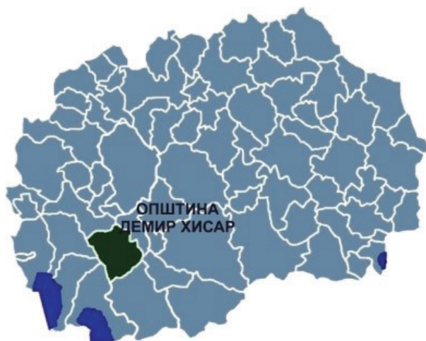
Слика бр. 1: Диспозиција на општина во Северна Република Македонија

Општината формирана е во 1946 година. Општината е сместена во југозападниот дел на РС Македонија и го зазема просторот во горното сливно подрачје на река „Црна“ која тече низ средишниот дел на општината. Опкружена е од сите страни со ридско-планинско земјиште кое се издига над рамничарските алувијални терени и создава природна целина отворена по текот на река „Црна“.